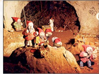
Sandstein- und Märchenhöhle