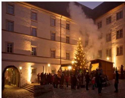
Copyright 12: Tourist Info Fladungen - Fotograf Nikolaus Schmidt